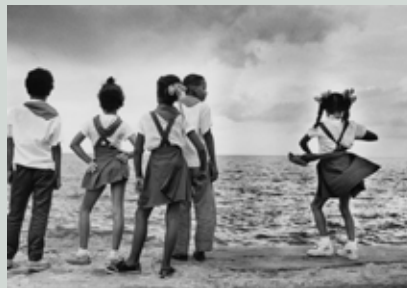
Schulkinder, 1996, aus der Serie »Havanna zwischen den Zeiten«

25 Jahre OSTKREUZ Film und Talk 7. Juli um 19 Uhr