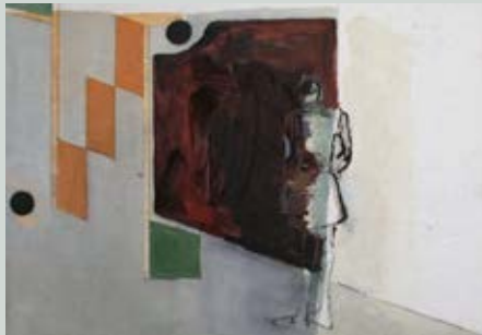
Im Museum II, 2016

Ausstellungseröffnung Annelise Hoge Malerei und Grafik